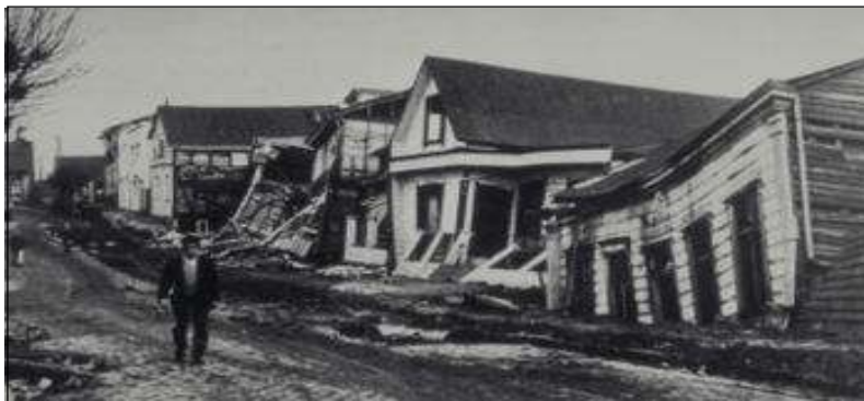
Straat in Valdivia na de aardbeving van 1960.

De zwaarste catastrofe die Valdivia getroffen heeft is de hevige aardbeving van 1960. Catastrofale aardbevingen hebben zich in Chili herhaaldelijk voorgedaan, vooral in de noordelijke regio's. Zuid-Chili gold echter als aardbeving-vrij. Op 22 mei 1960 zou de regio van Valdivia de hel beleven. Er waren al enkele voorschokken geweest, maar om 15u12 kwam de enorme hoofdschok die 3½ minuten duurde en een hevigheid bereikte van 12 (= maximum) op de schaal van Richter. De grond zakte enkele meter in, huizen, muren, pijpleidingen werden door elkaar geschud, mensen werden over de grond geslingerd. In de volgende dagen en uren werden nog meer dan 50 naschokken gevoeld van minstens 5 op de Richterschaal. De stad Valdivia werd het ergste getroffen. In totaal telde de regio 1000 doden en 50 000 vernielde huizen. De meeste slachtoffers vielen echter ten gevolge van de vloedgolven ('tsunami's'), die langs de kust 12 meter hoogte bereikten en langs de Rio Valdivia 25 km diep het binnenland instormden en er schepen en huizen meesleepten, waardoor de stad nog maandenlang van alle spoor- en wegverbindingen afgesneden werd en 15 000 ha weiland definitief verloren gingen. Bergstoringen richtten overal grote schade en damden het dal op verschillende plaatsen af. Weken later brak het opgespaarde water er doorheen, wat opnieuw krachtige modderstromen veroorzaakte.