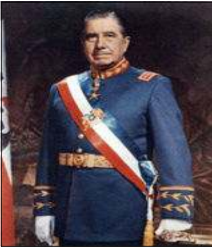
Augusto Pinochet Ugarte President 1973 -1989

De kansen van rechts om Allende op legale manier op zij te zetten waren toen verkeken. Om het opstandige leger in handen te houden werd generaal Augusto Pinochet Ugarte op 23 augustus 1973 minister van defensie in de regering van Allende. Maar Pinochet pleegde al enkele dagen later, op 11 september 1973, samen met legeraanvoerders en gesteund door CIA en USA, een verregaande staatsgreep. Het moneda-paleis werd gebombardeerd en president Allende vond daarbij de dood. In een laatste radioboodschap had hij nog zijn hoop voor Chili's toekomst uitgesproken: "Lang leve Chili, lang leve het volk, lang leve de arbeiders. Dit zijn mijn laatste woorden, maar ik ben er zeker van dat mijn opoffering niet voor niets is geweest...". Zijn standbeeld staat nu op het plein vóór het heropgebouwde moneda-paleis.