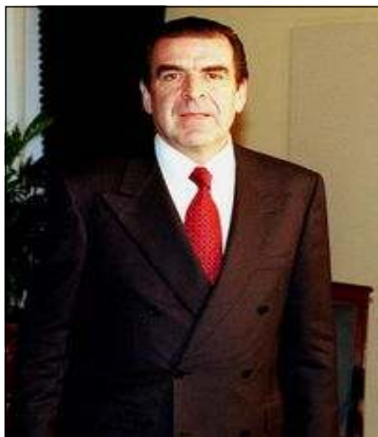
Eduardo Frei Ruiz-Tagle President 1994 - 2000

Ballingen uit het buitenland konden terugkeren, politieke gevangenen werden vrij gelaten. De uitgewekenen waren doorgaans ondernemende bekwame mensen, die elders een nieuw bestaan wisten uit te bouwen. Hun terugkeer was vaak een moeilijk proces. Sommigen van hen beschouwden allen die waren gebleven als ‘collaborateurs’, terwijl vele gebleven Chilenen die dag-in-dag-uit te maken hadden met dreigende militaire terreur de terugkerende emigranten beschouwden als ‘lafaards’ die weg waren gelopen. Zulke standpunten verzoenen werd een hele klus. Toch werd het land tamelijk rustig en de belangrijke politieke partijen waren het eens over de te varen economische koers.