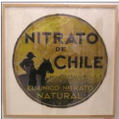
Chilisalpeter (Spanje 1930)

De Guano-meststof van Peru-Chili had op het einde van de 19de en begin 20ste eeuw wereldfaam. Typisch voor de kusten van Noord-Chili en Zuid-Peru zijn de eilandjes en de kliffen, bedekt met een mantel van witte uitwerpselen van guano-vogels (aalschelvers, jantvangenten en bruine pelikanen). De vogels leven er van de grote visvoorraden, vooral sardines. In de 'el niño-jaren', wanneer de voedselketen van het zeewater verstoord is, sterven de vogels massaal af op hun tocht naar het binnenland.