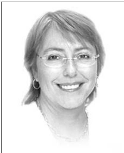
Michelle Bachelet. Eerste vrouwelijke presidente van Chili.