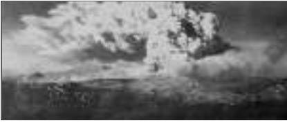
Uitbarsting van de vulkaan Puyehue op 200 km van het epicentrum.

richten nog ernstige schade aan in Hawaï en Japan. Een paar dagen na de hoofdaardbeving brak bovendien de vulkaan Puyehue uit en bedekte de ruime omgeving van de hoge cordillera met een asmantel.