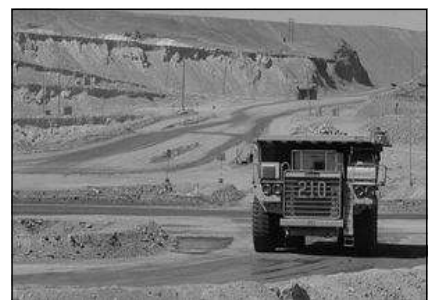
De grootste kopermijn ter wereld in Chuquicamata - Chili