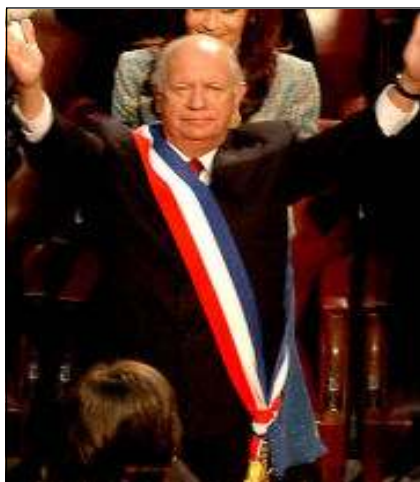
Ricardo Lagos President 2000 - 2006

Chili, dat de gentleman is van Latijns-Amerika met de sterkste economie van de regio, is een bevoorrechte handelspartner van de USA en Amerikaanse investeerders genieten veel bijval, zodat Chili geruisloos terug schuift in een USA-overheersing. Anderzijds blijft Chili opgescheept met een groot ‘eilandgevoel’, geklemd tussen de hoge Andes en de Pacifische Oceaan. Zo wordt het ook vanuit Europa bekeken en bestempeld. Toch verdient Chili beter. De