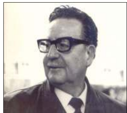
Salvador Allende Gossens President 1970 - 1973