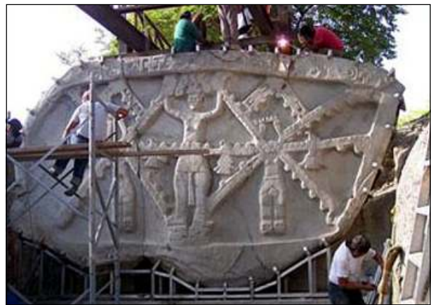
Foto en lijntekening van Monument 32 in Tamtoc

In the related to the archaeological work, he affirmed that the studies of the monolith 32 indicate that the huasteca culture is present from the preClassic to the postClassic, with elements that can give a radical change in the concepts that traditionally prevailed on the Mesoamerican culture.