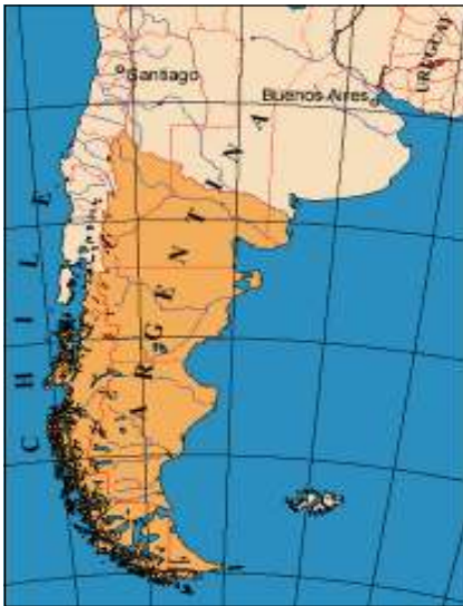
Chileens en Argentijns Patagonië.