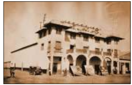
Theater van Chacabuco (ca. 1929)

de doodsteek voor de Chili-salpeter. De afzet verschrompelde, de fabrieken gingen dicht en de cités werden spooksteden. Een korte heropleving rond de Tweede Wereldoorlog kon de sector niet meer redden. Ik heb de 'oficina Chacabuco' bezocht, een van de laatst gebouwde salpetercités, een spookstad met ruïnes van verlaten wooncomplexen, casino, theater, fabriek enz., dat nu het statuut van nationaal monument heeft gekregen, maar tijdens het militaire regime van Pinochet een gevangenis was voor ruim 3000 politieke gevangenen.