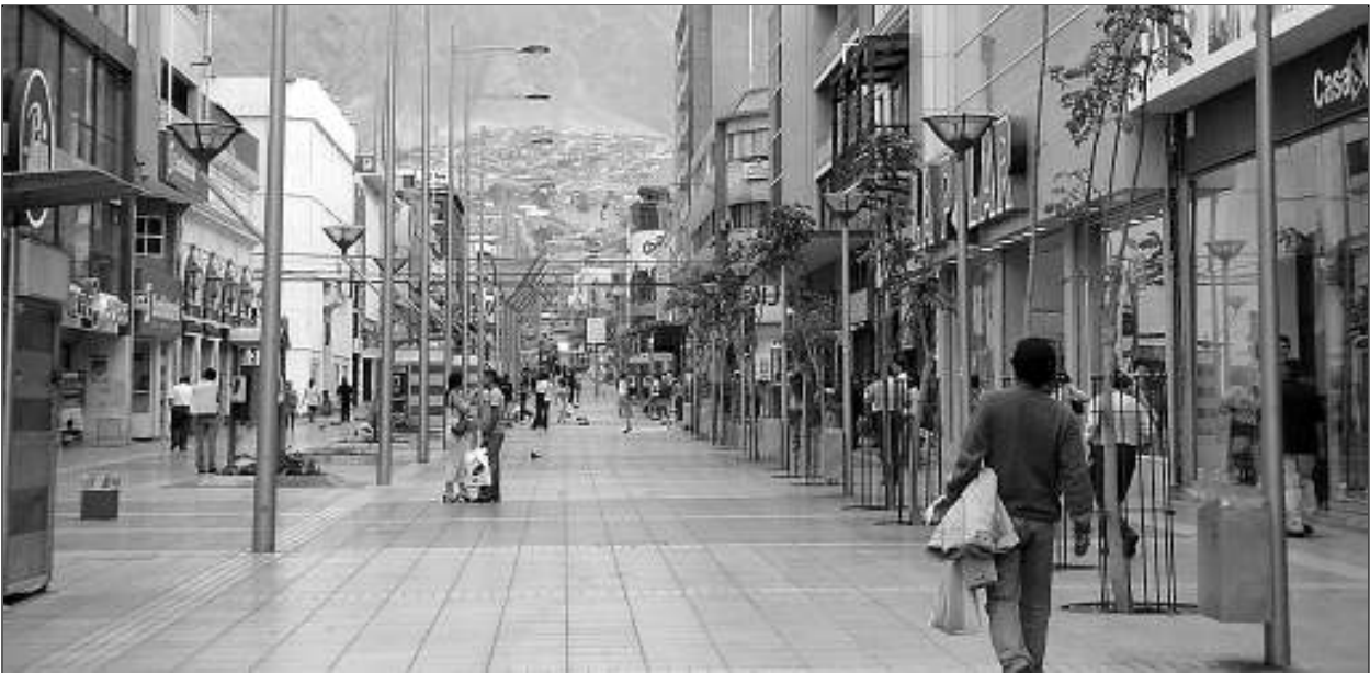
Paseo Peatonal Arturo Prat in Antofagasta met op de achtergrond de sloppenwijk op de berghelling.

7.2. Het onweer van Antofagasta. Antofagasta, de parel van Noord-Chili, is met ruim 200 000 inwoners de grootste stad van het droge noorden. De stad ligt op de steenbokskeerkring, waar de zon bij het begin van de zomer loodrecht invalt. Op zulke breedte domineren hoge drukgebieden en daar liggen ook de woestijnen. In Chili is de droogte extreem, versterkt door het kustgebergte en de koude 'von Humboldtstroom', die alle zeevochtigheid tegenhouden. Het regent er omzeggens nooit of beter gezegd na een eventuele regenbui volgen jaren zonder neerslag. Antofagasta moet zelfs het water halen van de hoge Andes over en afstand van bijna 300 km via pijpleidingen dwars doorheen de Atacamawoestijn.