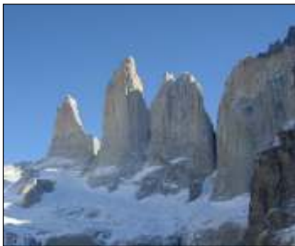
Nunataks in Torres del Paine