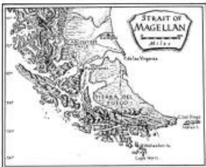
De straat van Magalhaes

De straat van Magalhaes hoort volledig tot Chili en aan de noordelijke oever ligt Punta Arenas, de hoofdplaats van Chileens Patagonië. De stad telt 120 000 inwoners, is kleurrijk en zeer levendig, gesitueerd aan de overgang van bos naar steppe en is ook de toegangspoort voor de eilandenarchipel van Vuurland. Punta Arenas werd in het midden van de 19de eeuw gesticht ter voorziening van de voorbijvarende schepen. Zeilschepen hadden het zeer lastig om tegen die sterke westenwinden in te varen, maar eenmaal stoomschepen ingezet konden worden en steenkool in de buurt werd gevonden, nam de betekenis van Punta Arenas sterk toe