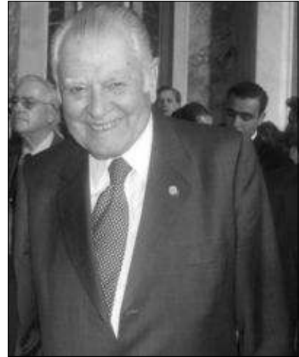
Patricio Aylwin Azócar President 1990 - 1994

Pinochet liet een nieuwe grondwet opstellen, die door twee derden van de Chilenen bij referendum werd goedgekeurd. Deze voorzag in een achtjarige ambtstermijn van de president met inperking van de macht van de politieke partijen. Uiteraard werd Pinochet zelf de president voor de jaren 1981-1989. Daarna zou er een referendum volgen waarbij de Chilenen zich zouden kunnen uitspreken voor een eventuele nieuwe termijn of voor presidentiële verkiezingen. Al na een paar jaar nieuwe grondwet nam de frustratie toe, verzwakte de economie, groeiden de protesten en stelde ook de katholieke kerk zich kritischer op. Ook buiten Chili kwam het schrikbewind van Pinochet onder hevig vuur te liggen. Het referendum leverde 54 % neen-stemmen zodat er verkiezingen werden uitgeschreven, die door de verenigde oppositiepartijen werden gewonnen en in december 1989 werd de christen-democratische leider Aylwin de nieuwe president.