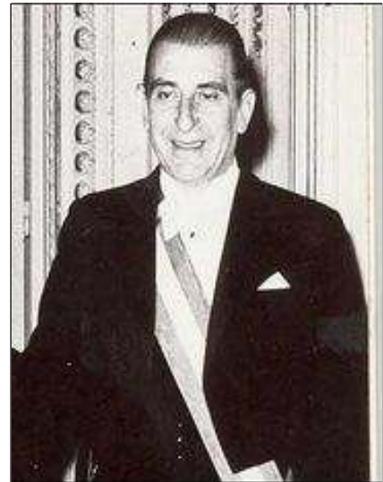
Eduardo Frei Montalva President 1964 - 1970

Alhoewel het volksfront geen meerderheid had in het congres en de senaat, zette de regering van Allende een radicaal hervormingsprogramma op, ten gunste van de armere bevolkingsgroepen. Sociale voorzieningen kregen meer geld, de landhervorming werd nog radicaler doorgevoerd en belangrijke industriële bedrijven en banken werden genationaliseerd. Over de snelheid waarmee die veranderingen moesten doorgevoerd worden was men in de coalitieregering verdeeld en sommige maatregelen (o.a. invoeren van een 'nationale eenheidsschool') kregen hevige tegenwind. De hervormingen remden ook het goed functioneren af van industrie en landbouw. Amerikaanse invloed, het leger en de elite poogden bovendien de volksfrontregering te destabiliseren. Niettemin won Allende, dank zij de steun van het gewone volk, opnieuw de verkiezingen van 1973.